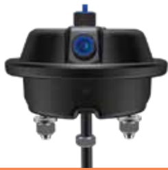
CS16LH (montrée) Entièrement scellée

Remarque : toutes les dimensions sont affichées en pouces et sont assujetties à la modification de la conception.