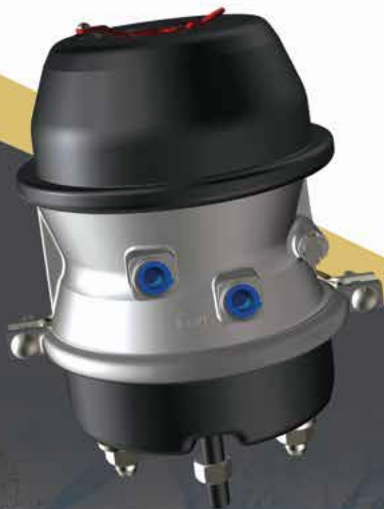
TR-LP3THD Modèle montré

Assure une force de freinage de stationnement supérieure quand vous en avez le plus besoin.