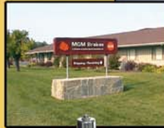
Arriba: Fábrica de Frenos MGM, Murphy, Carolina del Norte Izquierda: Fábrica de Frenos MGM, Cloverdale, California