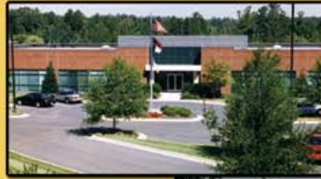
Parte superior: Sede IHI